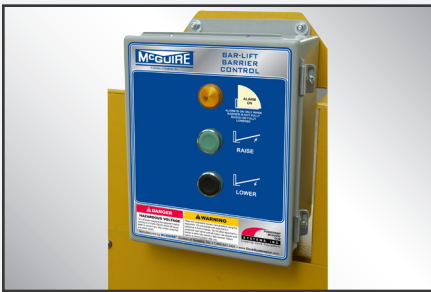
Con capacidad para interbloqueo con cortina, nivelador, retenedor y otros elementos motorizados en el muelle/andén.