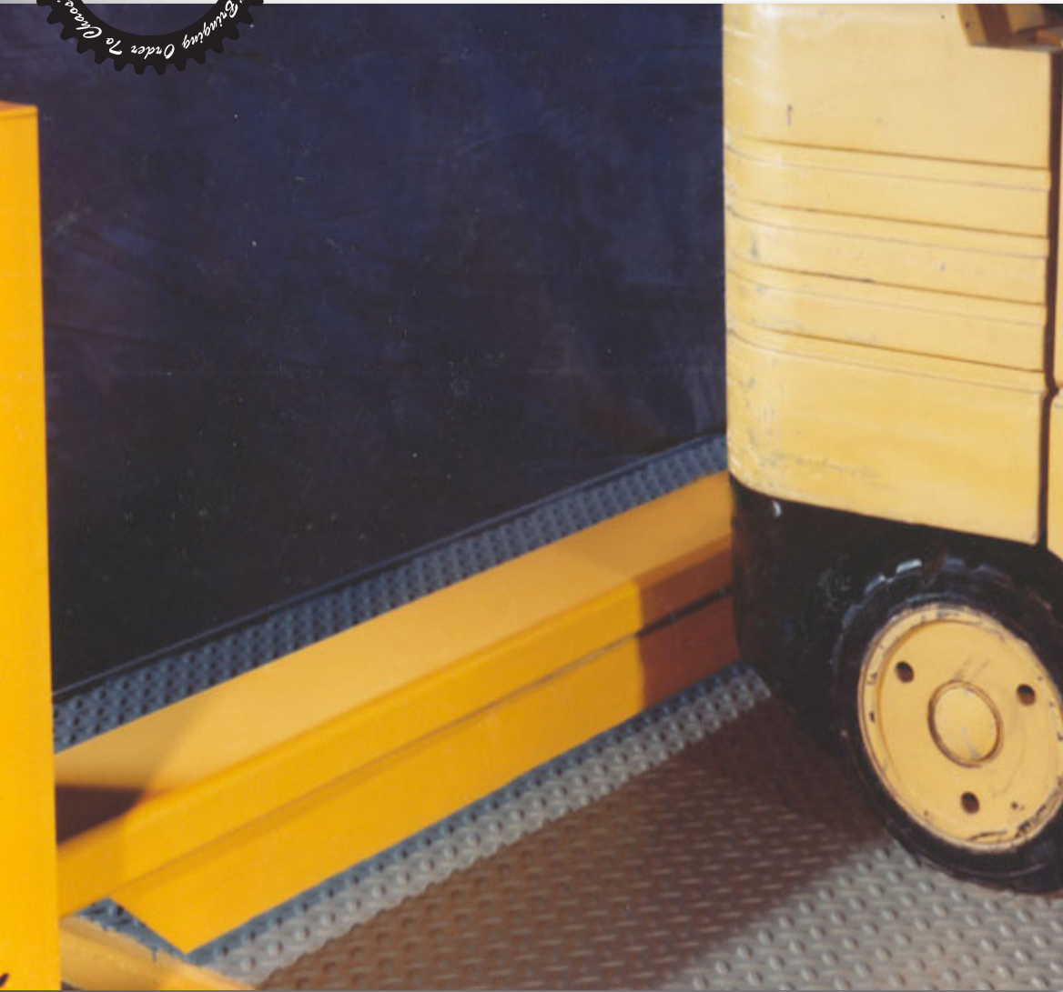
Se muestra barrera de elevación de barra