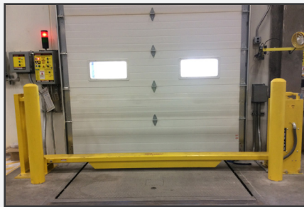
Protección contra colisiones para cortina metálica.