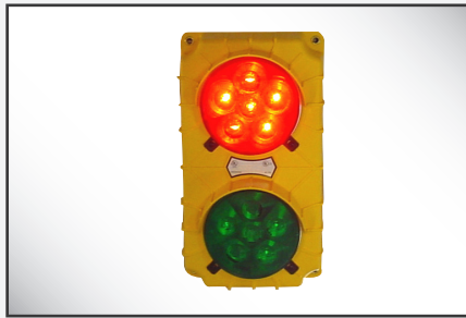
Luces exteriores: incandescentes de manera estándar, con LED opcional para una vida útil prolongada.