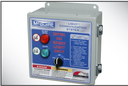
Panel de control del sistema de comunicación por luces para luces automáticas; el panel de control manual de luces es similar.