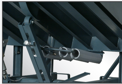
Conjunto principal de resortes ajustable en un punto con construcción de rodillo y leva.