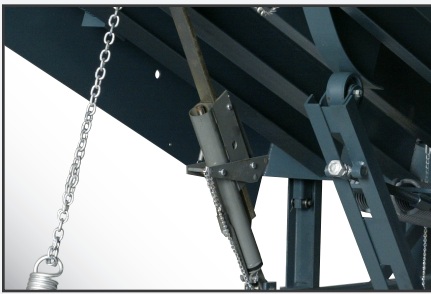
El exclusivo conjunto de sujeción permite la oscilación completa y la capacidad de liberación automática con remolques neumáticos.