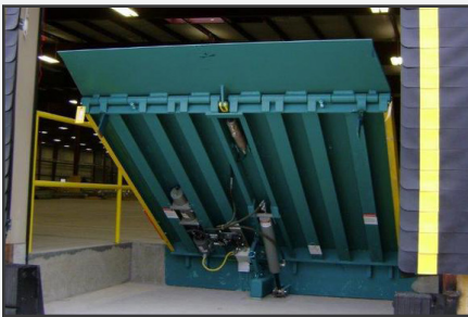
Margen de servicio de 25 cm (10") sobre y 20 cm (8") bajo el muelle/andén líder en la industria.