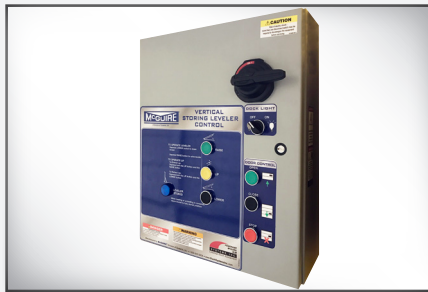
Sistema de control avanzado con capacidad para integrarse a todos los equipos de muelle/andén de carga.